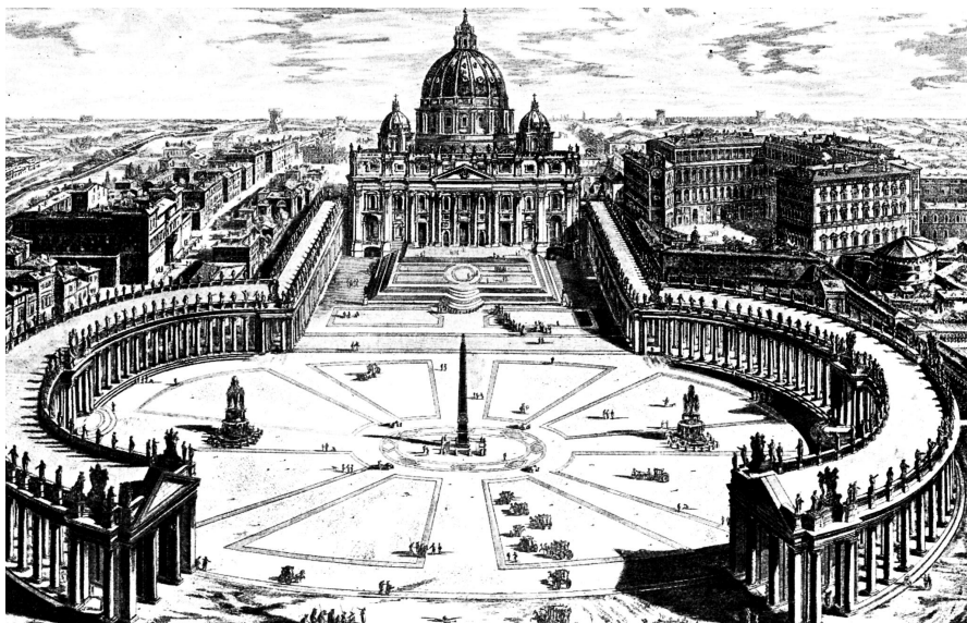
Peterskirche (Stich: Giambattista Piranesi)

„Ihr Begräbnis war eine ganz große Sache im Testaccio-Viertel. Hunderttausend Menschen folgten dem Sarg, mehr als bei jedem Politiker“, so lautet der typische Vergleich, eine Frau, die den römischen Dialekt in die Welt getragen hat bis nach New York. Ob die sechziger und die siebziger Jahre jemals wiederkommen. Mapete, come eravamo giovani e belli in quei giorni passati . Ein Todesfall, der Nostalgie erzeugt. „Die Melodien der Ferri waren konventionell, aber mit ihren