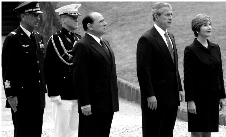
Berlusconi, George W. Bush und Laura Bush bei der Kranzniederlegung im Rom am 4. Juni 2004

Die Begrüßung nimmt Roms Bürgermeister Walter Veltroni von den DS vor. Ohne Namen zu nennen, stellt er gleich den Zusammenhang zwischen den bei-