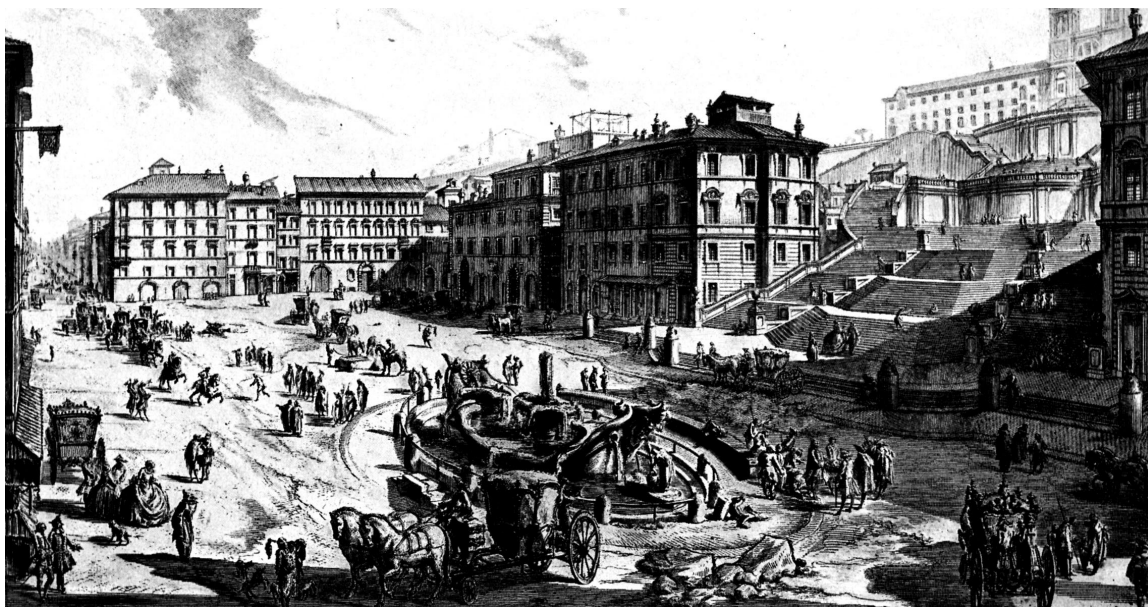
Piazza di Spagna

Roma, città aperta war eine Formel, die noch ihre Faszination ausübte. Viel später lernte ich von Robert Katz ( The Battle For Rome , 2003), dass sie von Papst Pius XII. stammte. Den dazugehörigen Film von Roberto Rossellini mit Anna Magnani und Aldo Fabrizzi habe ich erst später in München gesehen; aber einen anderen über den Partisanenkrieg in der Po-Ebene, Paisà, sah ich mit meinem Vater Mitte der fünfziger Jahre. Gut zwanzig Jahre bevor die Fernsehserie „Holocaust“ bei vielen Deutschen die gleiche Wirkung erzielte: dass sich nämlich der deutsche Zuschauer gegen die deutschen Soldaten mit deren Gegnern und Opfern solidarisierte.