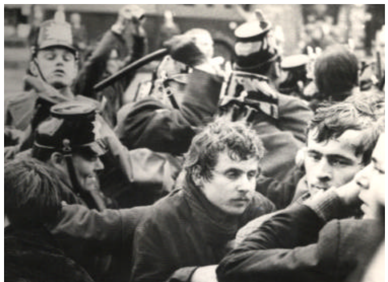
Studenten und die Polizei, Berlin 1968

Stephan Wackwitz beschreibt in seinem Familienroman „Ein unsichtbares Land“ eine Erinnerungsreise durch die zertrümmerte und diskreditierte Welt der Väter und Großväter, eine Beschreibung, die in ihrer Behutsamkeit und Umsicht im breiten Strom der von konditionslosem Subjektivismus getriebenen autobiographischen Bekenntnisliteratur ihresgleichen sucht. Unter Wahrung der ethischen, durch das Verbrechen des Nationalsozialismus vorgegebenen Scheidelinie steuert der 1952 in Stuttgart geborene Leiter des Krakauer Goethe-Instituts die Auseinandersetzung mit seinen männlichen Vorfahren auf einen dritten Punkt hin, der jenseits von Freispruch oder Verdammung, Versöhnung oder Lossagung liegt. Selbst wenn es möglich wäre, so Wackwitz, sich