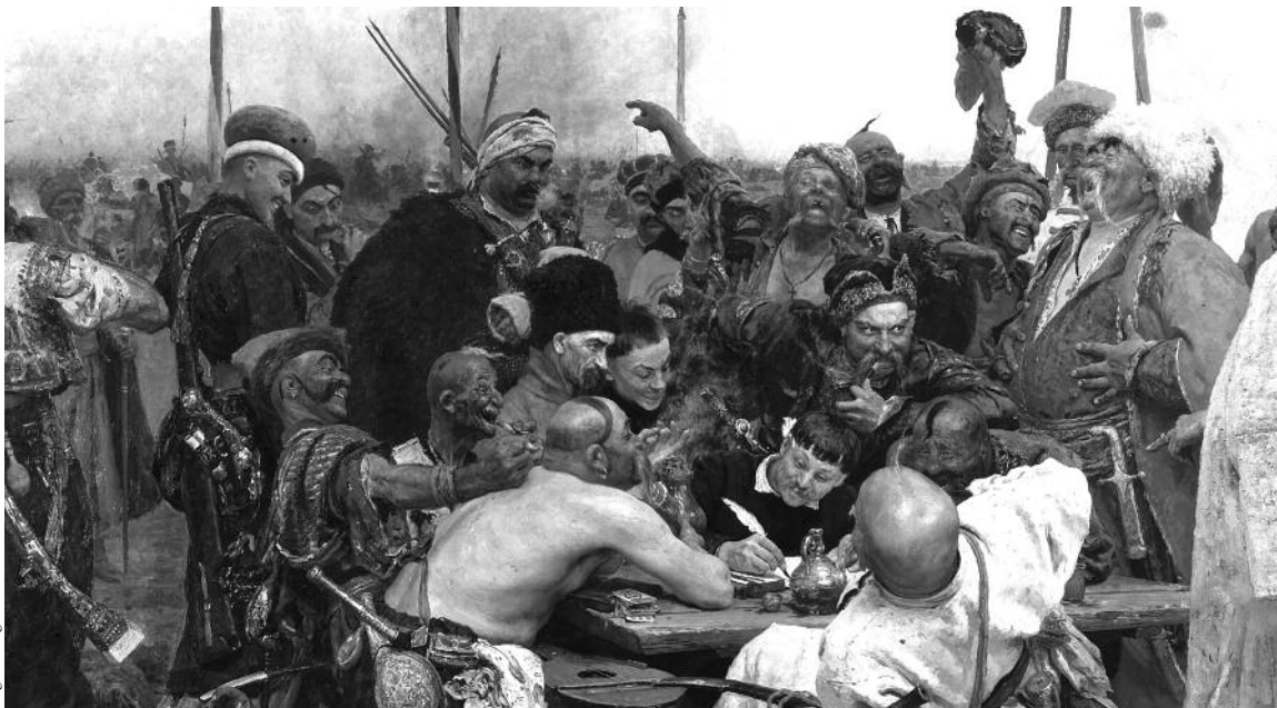
Ilya Repin, Die Saporoger Kosaken verweigern dem Sultan die Zahlung von Steuern (1880)

In aller Form war das schon im 6. Jahrhundert vor Beginn unserer Zeitrechnung der Fall, als Solon in dem von Schulden gelähmten Athen die Macht übernahm. Seine Erklärung der völligen Zahlungsunfähigkeit (»das Abschütteln der Lasten«) brachte den Stadtstaat zu Demokratie und Wohlstand. Das in unserer Erinne-