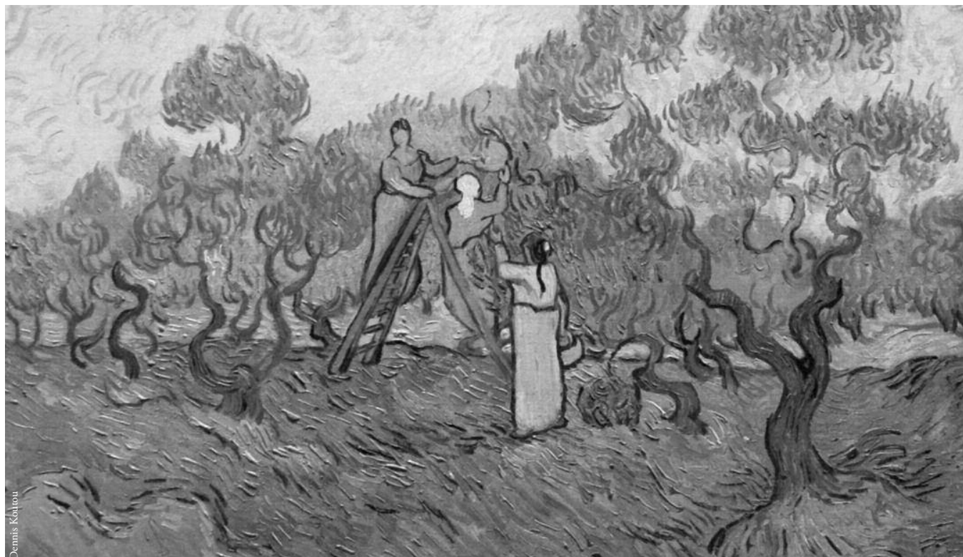
Devisenbringer (Vincent van Gogh, Olivenpflückerinnen, 1888/89)

Griechenland ist das einzige Land, in dem Steuern in Naturalien bezahlt werden. Das Geld ist auf dem Lande so rar, dass man sich auf diese Form der Steuererhebung herablassen musste. Anfangs versuchte die Regierung noch, die Steuer zu verpachten, aber die Bauern, die nur zaghaft davon Gebrauch machten, hielten ihre Verpflichtungen nicht