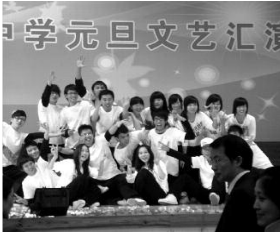
Mit Perspektive: chinesische Schulklasse (Dezember 2009)

Allein seit Beginn des 20. Jahrhunderts hat sich das Medianalter der Deutschen wie das der meisten anderen Völker früh industrialisierter Länder von 23 auf 46 Jahre verdoppelt, der Anteil mindestens 60-Jähriger von acht auf 26 Prozent mehr als verdreifacht und der Anteil der mindestens 80-Jährigen von 0,5 auf 5,3 Prozent reichlich verzehnfacht. Das aber ist erst der Anfang. Bis 2050 wird der Anteil mindestens 60-Jähriger weiter auf annähernd 40 und derjenige mindestens 80-Jähriger auf etwa 12 Prozent steigen.