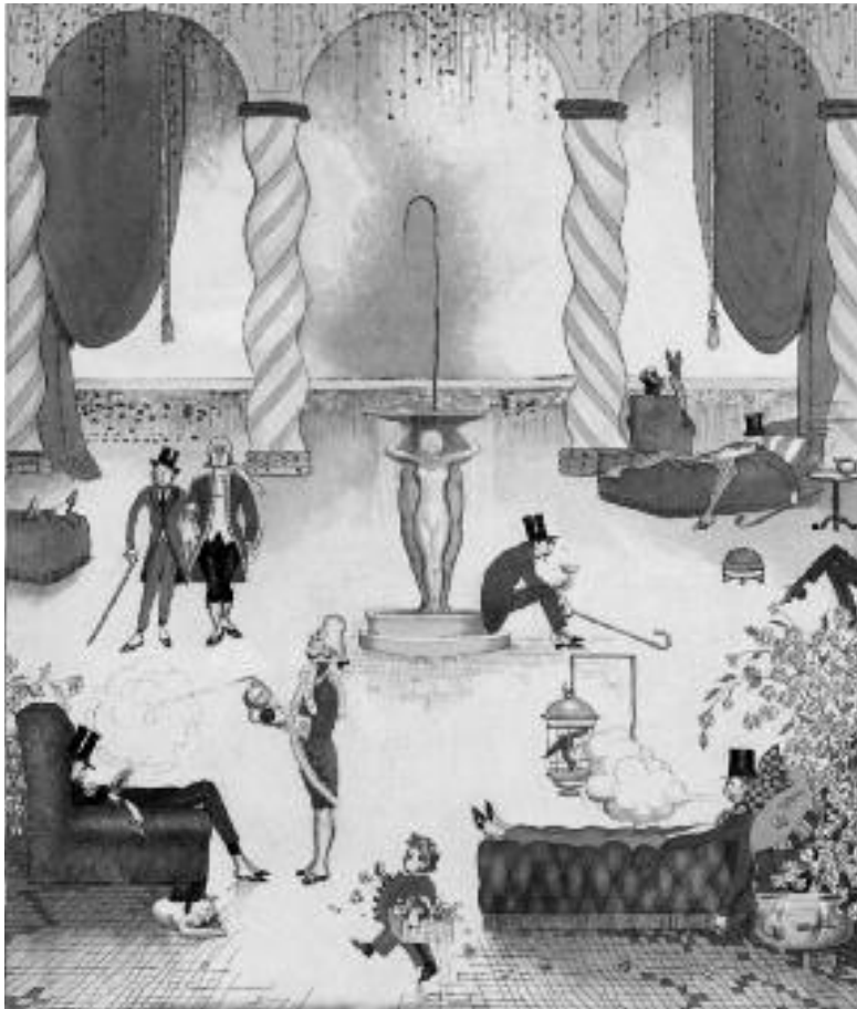
Club der pensionierten Söhne (Karikatur von Rea Irvin, 1914)

Nicht zuletzt diese Verschuldung steht wie ein Fanal, dass sich zumindest in den früh industrialisierten Ländern das Glücks- und Heilsversprechen eines sinnerfüllten Lebens durch fortdauernde materielle Wohlstandsmehrung erschöpft hat. Denn mit dieser Verschuldung wird nur kaschiert, dass es in diesen Ländern für die große Masse der Bevölkerung kein Wachstum mit Wohlstandsteigerung mehr gibt und sie im besten Fall auf der Stelle tritt. Alles, was ihr noch an Expansion geboten wird, ist Schaum, entwerteter Geldschaum.