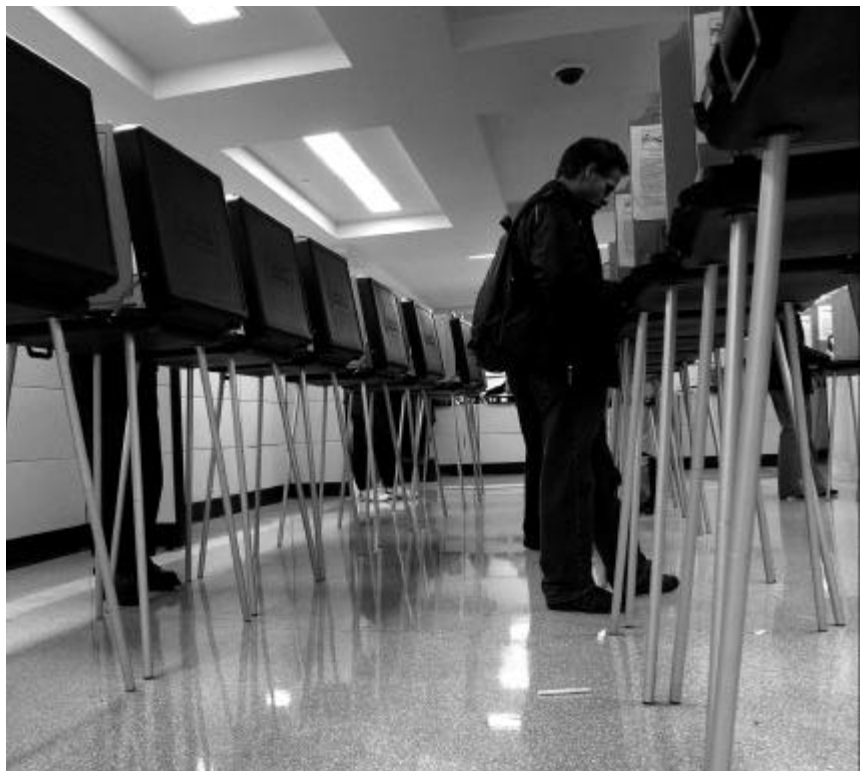
Wahlcomputer in San Francisco bei den Vorwahlen am 2. März 2004

Noch bedenklicher aber war die Reparatur erkannter Fehler. Im Prinzip müssen alle Wahlcomputer von einer Prüfstellung wie den Wyle-Labors kontrolliert werden. Erst nach dieser Endabnahme erhalten die Geräte, jedes einzeln, ein staatliches Zertifikat, und erst dann können sie eingesetzt werden. Dieser offizielle Vorgang wurde jedoch von Diebold gezielt unterlaufen. Die Firma stellte nämlich bei bereits zertifizierten, also freigegebenen Geräten eine ganze Reihe von Funktionsstörungen fest. Also wurden die Geräte in eine Lagerhalle transportiert, eine unbewachte Lagerhalle. War dies nur eine gefährliche Sorglosigkeit, so war der nächste Schritt ein gewollter Verstoß gegen das Prüfverfahren: Diebold ließ sogenannte patches programmieren, kleine Reparaturprogramme, die auf die Geräte aufgespielt werden und den Fehler beheben sollten. Diese patches waren jedoch nie durch das offizielle Prüfverfahren gegangen. Ihre Verwendung in den bereits freigegebenen Maschinen war mithin illegal. Und nicht nur dies: Die patch -Dateien standen zum Herunterladen durch die Reparateure in einem Datei-Server im In-