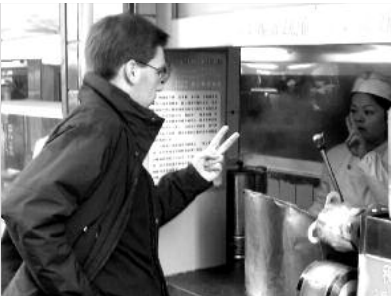
„Bitte zwei Frühlingsrollen“: Kommunikation und die Märkte

Das Genannte hat fundamentale Bedeutung auch für die Form der akademischen Lehre, denn es kann dann nicht mehr so ohne weiteres, wie wir es jetzt betreiben, zwischen Lehre (kodifizierter Standard) und Forschung (Theoriendynamik) getrennt werden. Die Studenten müssen gleich in die Forschung mithineingenommen werden – Humboldts altes Programm. Nur so bekommen wir gebildete Ökonomen – deren Wissen nicht vor jeder Krise bewahren wird, aber immerhin ökonomische Prozesse transparenter, durchschaubarer werden lässt.