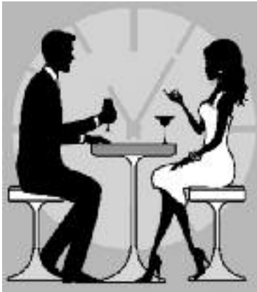
Das kleinste soziale Netzwerk: Entscheidungsfindungen

7. Die Auseinandersetzung mit systemtheoretischen Erwägungen wird besonders bedeutsam im Bereich der Prognostik; es gibt nämlich massive methodische Einwände bei der Modellierung von Erwartungen und zukünftigen Ereigniseintritten, formuliert etwa von Nissim Nicholas Taleb, Benoît Mandelbrot, Didier Sornette oder Elena Esposito. Das ist umso gravierender, als auf den Finanz- und Kapitalmärkten auf Basis ausgefeilter Algorithmen in Computersystemen Berechnungen zukünftiger Wertentwicklungen nicht nur eingefordert, sondern längst global praktiziert werden. Weit über das klassische Banking hinausgehend werden Futures, Optionen und Derivate gehandelt, also Wertdifferenzen künftiger wirtschaftlicher Ereignisse, die nicht individuelle Risiken bergen, sondern kaum kalkulierbare Netzwerkeffekte erzeugen.