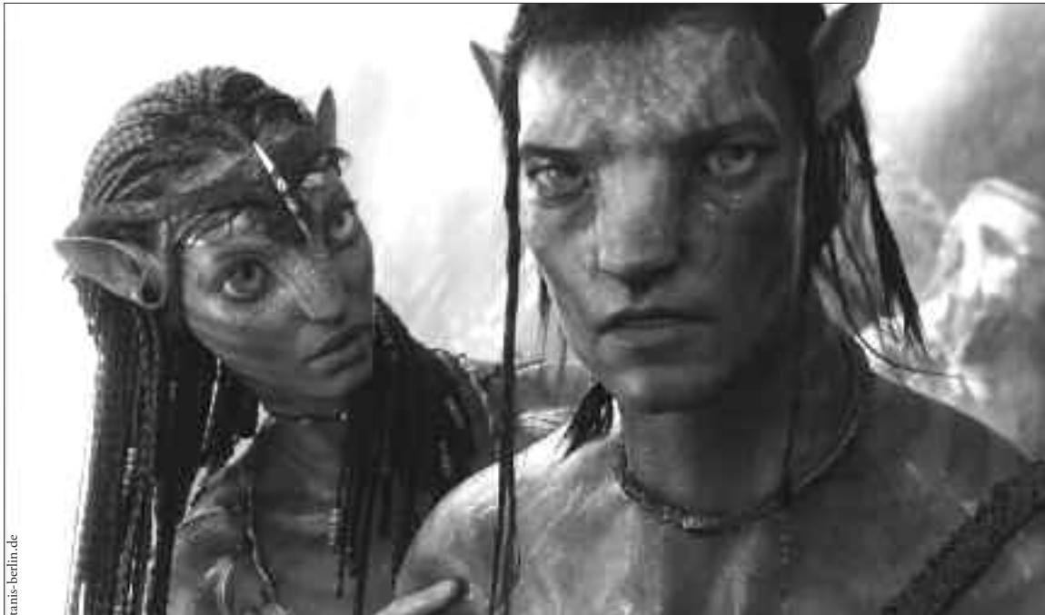
Die Na'vis auf Pandora: Für manche zu schön, zu harmonisch