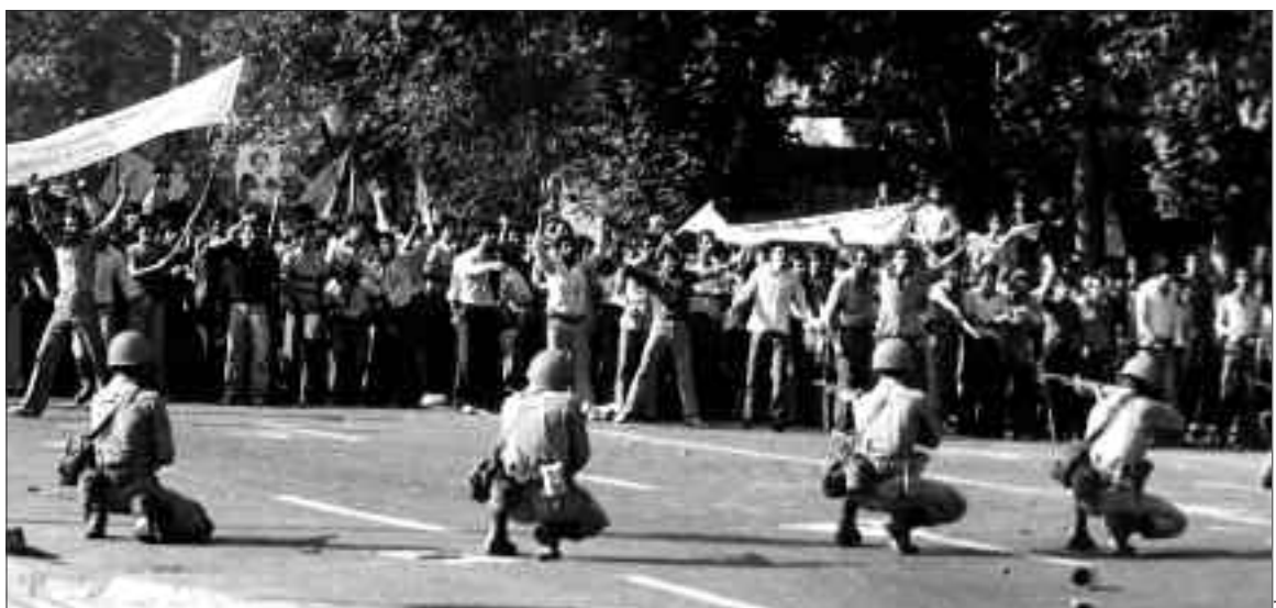
Unangemeldete Revolution: Teheran, August 1978

In seinen Memoiren zitiert Jimmy Carter eine Geheimdienstanalyse vom August 1978, die ihm mitteilte, der Iran „befindet sich nicht in einer revolutionären oder auch nur prärevolutionären Lage“. Im Januar 1979 musste Schah Reza Pahlavi aus Teheran fliehen. Ende 1980 gewann Ronald Reagan mit einem Erdrutsch-Sieg den Wahlkampf und berief Henry Kissinger in seinen Beraterstab. Kissinger empfand das Unvermögen, die Ereignisse im Iran vorherzusagen, als persönliche Demütigung; er wollte, forderte er von den Geheimdiensten, künftig 72 Stunden vorher von jedem Staatsstreich informiert sein. Er beauftragte deshalb die