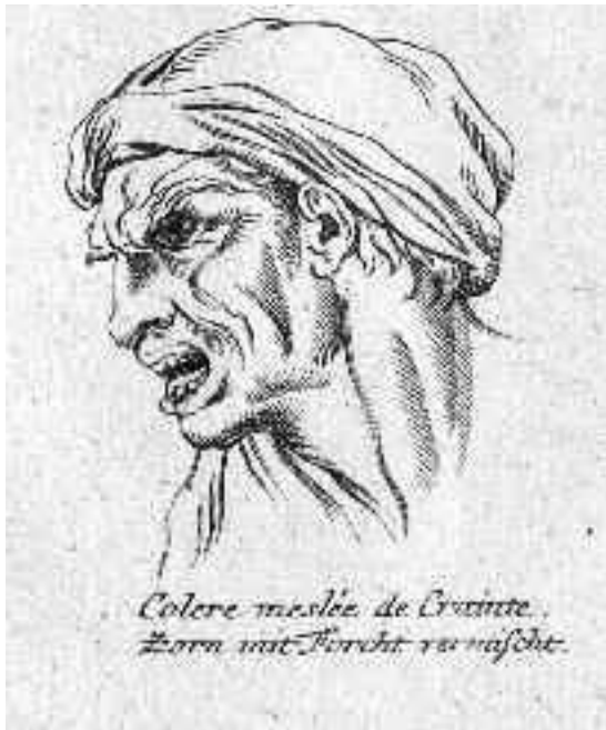
Gesichtskontrolle statt Nacktschannern

in dem Film Minority Report ) beschäftigt Experten in Israel und den USA ( modesto.bee.com ):