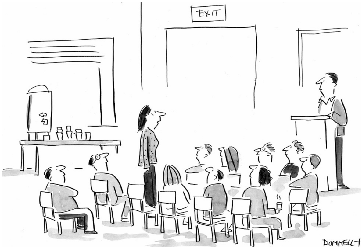
Bei den Anonymen Twitterern: „Das letzte Mal war vor zwei Monaten.“

So twittert Sichelputzer: „Als vor einem Jahr die Leute noch in der Bahn Zeitung morgens lasen. Heute kein Printprodukt gesehen, nur Smartphones.“ So viel zum Thema „Nichts geht über die Zeitungs-Haptik“. Aber die News kommen doch immer noch von Journalisten, oder? Nun, nicht immer, auch wenn es erst wenige Highlights gibt: Hudson Plane Crash, Iran, Amoklauf in Winnenden, San Francisco Bay Bridge, Hudson Heli Crash. Je mehr Menschen mobile Technik haben, desto schneller ist ein Photo geschossen, ein Tweet abgesetzt (ebenso das Foto, in Sekundenschnelle weltweit verfügbar), ein Augenzeugen-Telefon-Interview gegeben. Bisher kannte der Journalist keinen wirklichen Wettbewerb, nun steht er öfter schon nicht mehr im Fokus des Geschehens.