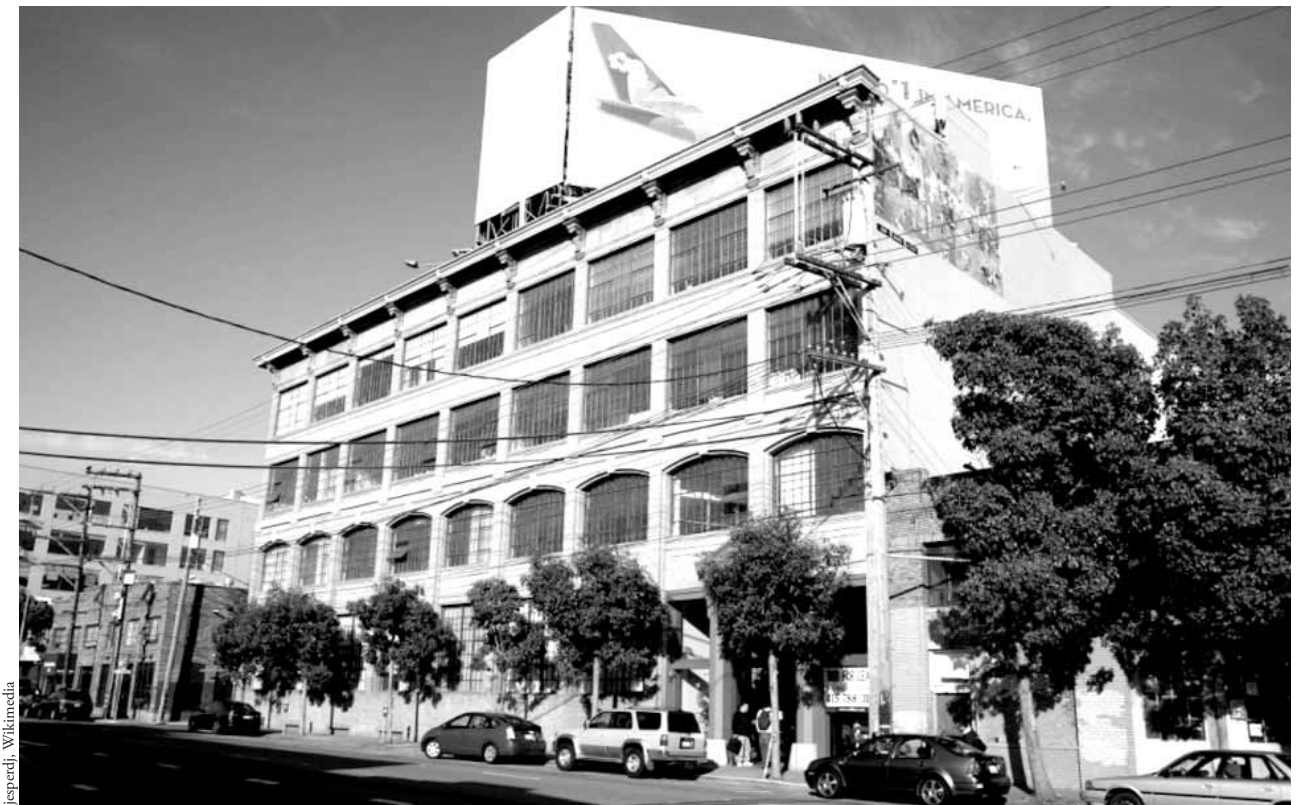
Twitter-Firmensitz im 3. Stock, Bryant Street 539, San Francisco

Pro: Offen eben wie auf einer Cocktail-Party! Macht man dort nicht auch, auf diese zufällige Art, weil man etwas aufschnappt, die interessantesten Bekanntschaften, deren wahre Bedeutung sich erst in der Folge herauskristallisiert?