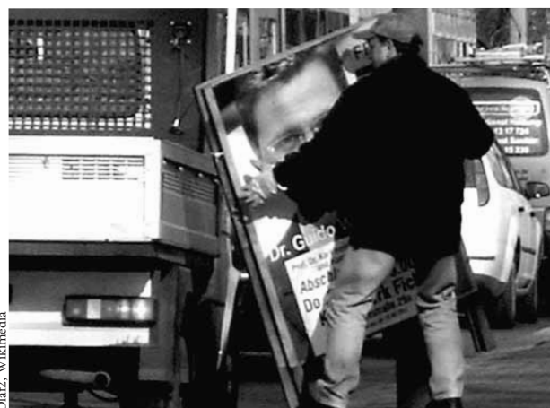
Abgeräumt durch das Ordnungsamt schon vor dem Wahltag (wegen unerlaubter Aufstellung, Sachsen-Anhalt 2006)

MOTTO DER KANZLERIN: WECKE KEINE ERWARTUNGEN, UND DIR KANN NICHTS PASSIEREN.