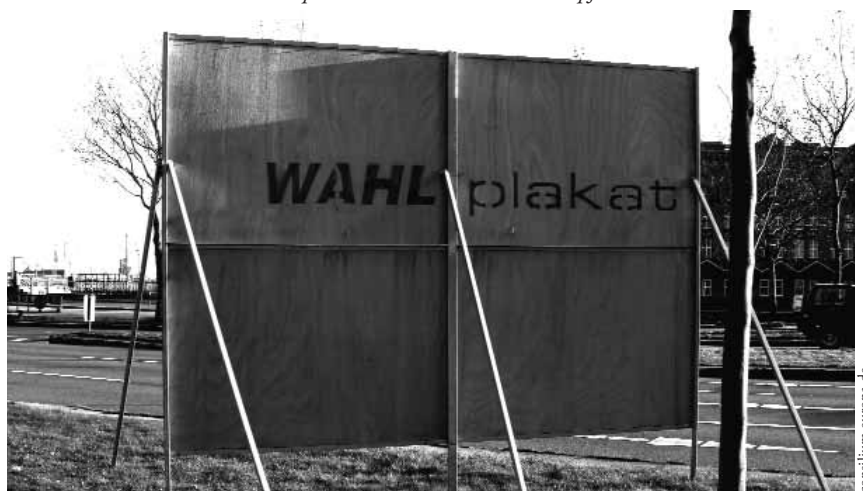
Die spannendere Seite des Wahlkampfes

Dabei sind die akuten Gefährdungen der Demokratie in den vergangenen zwei Jahrzehnten alles andere als geringer geworden. Der demokratisch-republikanische Zusammenhalt im Lande wird sichtbar dünner. Mehr und mehr nähern wir uns einem Zustand, den der britische Politikwissenschaftler Colin Crouch als post-demokratisch bezeichnet. Der Begriff der Postdemokratie beschreibt für Crouch Situationen, „in denen sich nach einem Augenblick der Demokratie [wie 1989] Langeweile, Frustration und Desillusionierung breitgemacht haben; in denen die Repräsentanten mächtiger Interessengruppen, die nur für eine kleine Minderheit sprechen, weit aktiver sind als die Mehrheit der Bürger, wenn es darum geht, das politische System für die eigenen Ziele einzuspannen; in denen politische Eliten gelernt haben, die Forderungen der Menschen zu lenken und zu manipulieren; in denen man die Bürger durch Werbekampagnen ‚von oben‘ dazu überreden muss, überhaupt zur Wahl zu gehen.“ Crouch diagnostiziert also eine Deformation der Demokratie, die sich nicht als Bruch und plötzlicher Systemwechsel vollzieht, sondern „als schleichender Verrottungsprozess“ (Claus