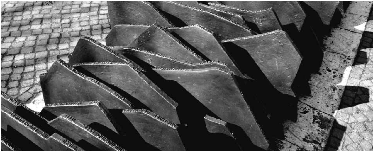
Denkmal für die 96 von den Nationalsozialisten ermordeten Reichstagsabgeordneten

Hier – und nicht in bloßer Wahlarithmetik – liegt das eigentliche Problem: Nach jetzt elf Jahren an der Regierung, anfangs unter dem eigenen Kanzler, danach unter der ersten Kanzlerin, ist insbesondere der Sozialdemokratie und der deutschen Linken insgesamt eine politische Alternative abhandengekommen. Anders 1969: Damals hatte die deutsche Sozialdemokratie zwanzig Jahre einer Durststrecke hinter sich. 1949, bei den ersten Bundestagswahlen, als heimlicher Favorit am Start, gelangte sie gegen den Überkanzler Adenauer erst mit dem Godesberger Programm vom November 1959 in die Nähe der Regierungsfähigkeit. Und danach mussten noch einmal zehn Jahre ins Land gehen, bevor sie endlich ihre lange vorbereiteten Konzepte umsetzen konnte – dann allerdings mit breiter gesellschaftlicher Wirkung, nach innen wie nach außen.