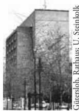
Gütersloh, Rathaus; U. Steinhilke