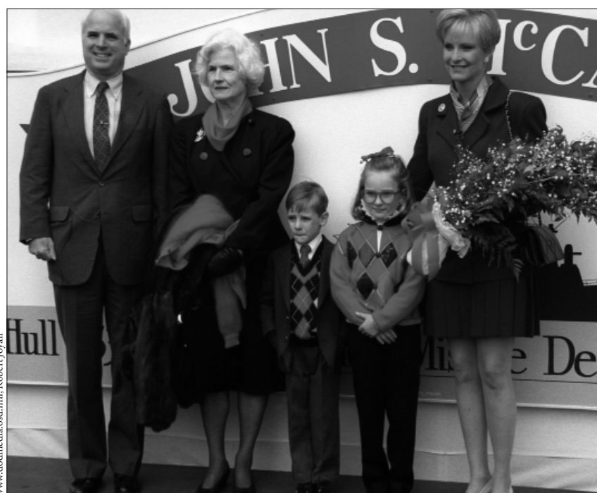
John S. McCain und Familie bei der Taufe des Zerstörers JOHN S. MCCAIN (26. 9. 1992)

Der Stern des Barack Obama ging vor vier Jahren beim demokratischen Parteikonvent in Boston auf. Er durfte als Hauptredner auftreten und sollte eigentlich den Präsidentschaftskandidaten preisen. Aber er sprach hauptsächlich von sich, seiner niederen Herkunft, seinem Weg nach oben, seinen hehren Zielen für Amerika. Bei richtiger Vorbereitung kann das Wort AMERICA