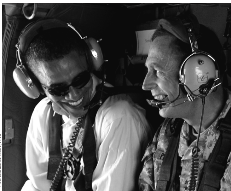
Barack Obama und General Petraeus im Hubschrauber über Bagdad (21. Juli 2008)

Dutzendfach ist versucht worden, die Höhe der Spendengelder zu begrenzen, und ebenso oft ist es Parteifunktionären gelungen, die Bestimmungen zu unterlaufen. Zum Beispiel mit Soft Money. Wer Werbung macht für eine Partei, um den Bürgersinn zu wecken, oder wer für einen Kandidaten eintritt, ohne das Wort vote zu verwenden, braucht sich an das Spendenlimit nicht zu halten. Soft Money ist beliebt bei Demokraten, weil Republikaner normalerweise mehr Hard Money aufreiben. Wer auf Bundesmittel ganz verzichtet, darf private Spenden unbegrenzt ausgeben. So hat es Obama gehandhabt. Kaum flossen die privaten Spenden dicker als erwartet, verwarf er das vorher von ihm gepriesene public financing . Und McCain suchte und fand Schlupflöcher in Gesetzen zur Spendenbegrenzung, die er selbst entworfen hatte.