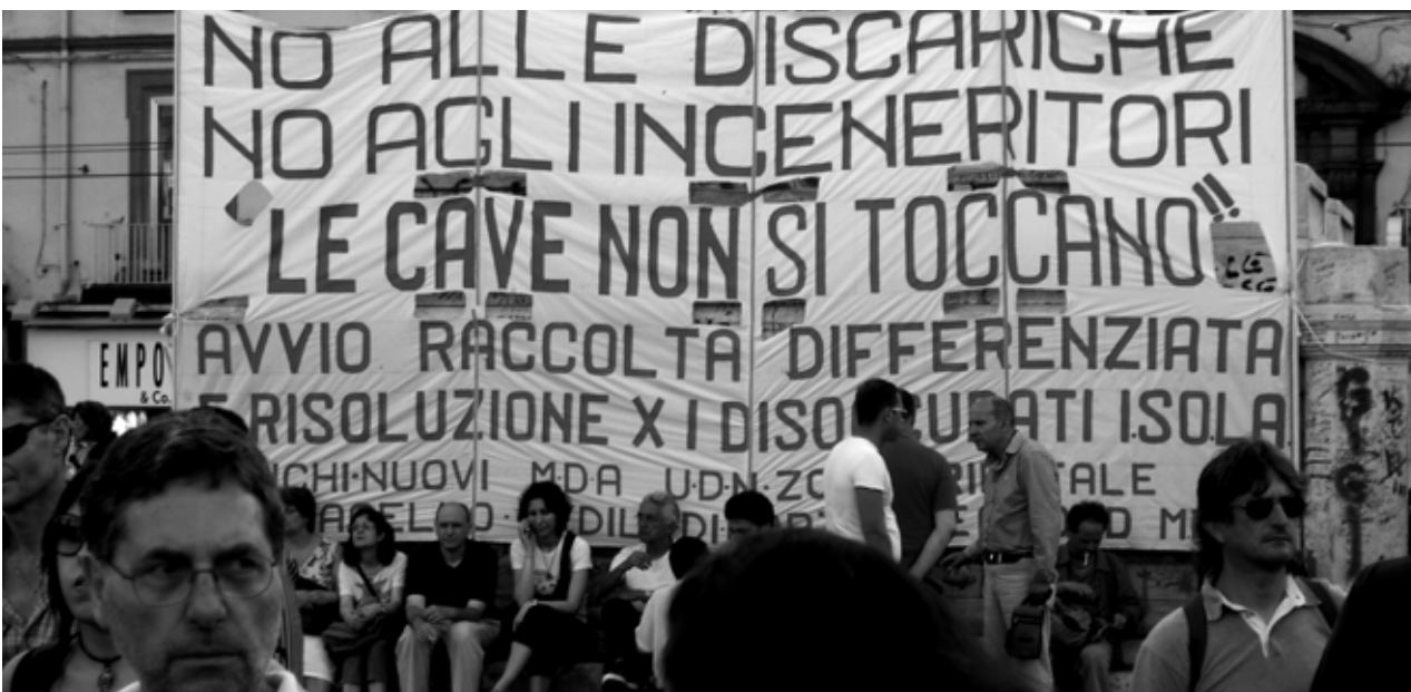
Demo gegen eine Müllverbrennungsanlage

Ausgangspunkt ist die Legende des Castel dell'Ovo. Die Neapel seeseitig schützende Festung sei auf Fundamenten gebaut, die ein Ei enthalten. Wenn dessen Schale breche, stürze nicht nur die Burg ein, sondern die ganze Stadt. Der Legende nach hat Vergil das magische Ei dort