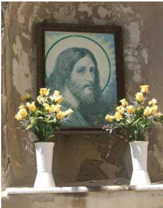
Wenn Il Cavaliere nicht mehr hilft

er ganz einfach den nächsten G8-Gipfel, der im Juni/Juli 2009 auf Sardinien stattfinden soll, zum Teil auf ein Kreuzfahrtschiff verladen, das dann vor den Kameras der ganzen Welt in ein sauberes Neapel ohne Rauchschwaden einlaufen wird. Der Mann versteht etwas von TV-Szenarien. Braucht er da noch ein Theaterfestival?