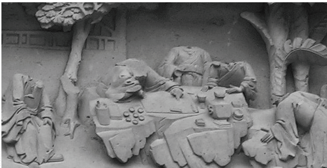
In der Kulturrevolution abgeschlagene Köpfe (Privatgarten in Soubou, China, Januar 2007)

journalismus. Wegen des Zeitaufwandes und zum Teil auch wegen der erforderlichen schriftstellerischen Fähigkeiten sind die Blogger allerdings nur ein kleiner Anteil der Internetnutzer. Zudem sind die Blogger mindestens zur Hälfte weitgehend