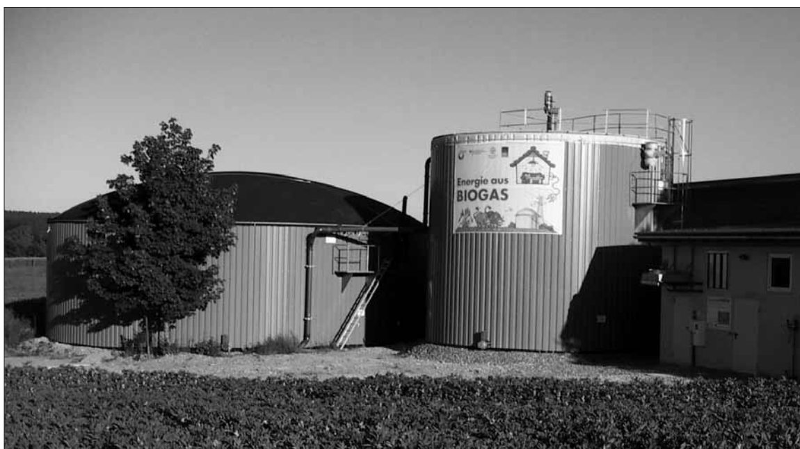
Der kommende Öko-Energiehof:

Aus welcher Region und von welcher Pflanze auch immer die Bio-Energie stammt, als Treibstoff für Kraftfahrzeuge ist ihre Nutzung am wenigsten effektiv. Die Nutzung biogener Brennstoffe im mobilen Bereich spart deutlich weniger CO 2 ein als beispielsweise ihr Einsatz in effizienten Kraft-Wärme-Kopplungsanlagen. Hier kommt Biogas ins Spiel, das einige der Probleme umgeht, die den Biokraftstoffen ein so schlechtes Image bereiten. Während für Biodiesel und Ethanol nur ein Teil der Pflanze in nutzbare Energie übergeht, vergären Biogasanlagen die gesamte Biomasse zu methanhaltigem Gas, das dem Erdgas ähnelt. Alle