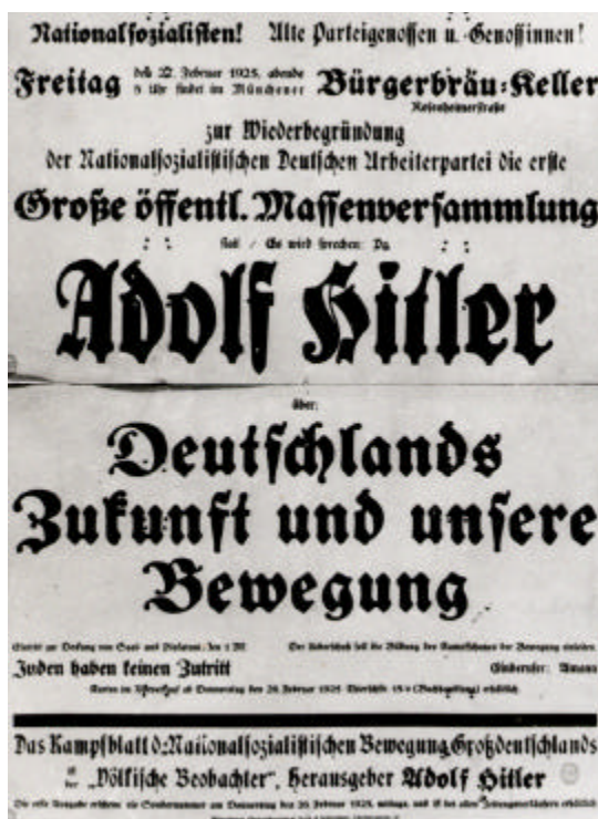
Das Plakat zur Versammlung in München, auf der Hitler die NSDAP „neu ins Leben“ rief.